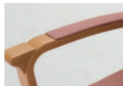
肘のあたりが柔らかいクッション付