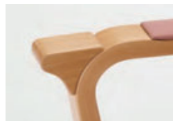
肘の先端部は握りやすく立ち上がりや着座の動作を補助