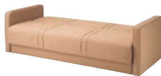
ソファから簡易ベッドへ。背はギアで2段階のリクライニング可能