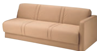
肘は車椅子への移乗やベッドにした時の介助がしやすいようにワンタッチで着脱