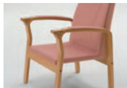
座面のクッション材を取り外しての使用も可能です。