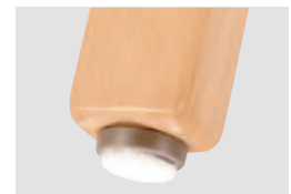
脚先端部はフェルトブラパートを採用。床面へのキズ防止、移動時の振動や引摺り音の防止に