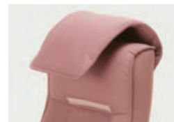
ヘッドレストは着脱式